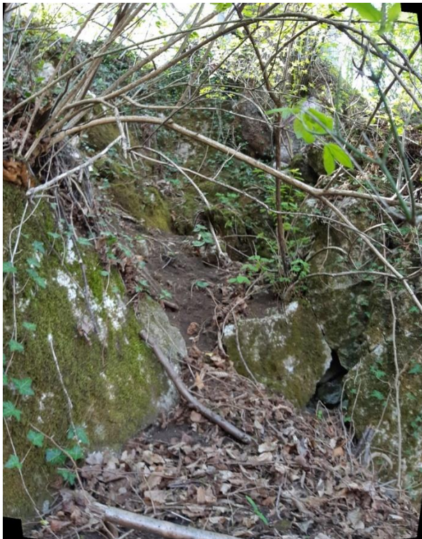
Slika 7 Mesto izpada klinastega bloka iz zgornjega dela strme skalne brežine nad Partizansko potjo 3 (P2).