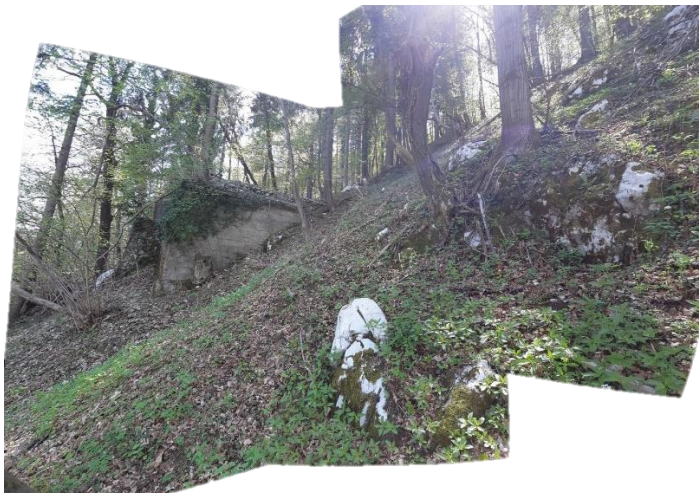
Slika 13 Območje opuščene vodohrana na območju profila P7 predstavlja skakalnico za višje odboje skalnih blokov!