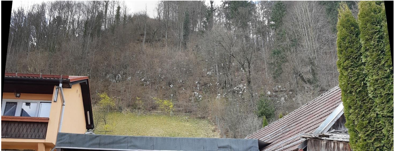
Slika 1 Pobočje pod Pustim gradom z izdanki apnenca nad stanovanjskim objektom Partizanska pot 7.