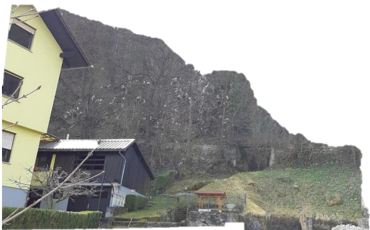
Slika 3 Strmo pobočje z izdanki apnenca na vzhodnem delu območja – pri opuščenem kamnolomu (P8, P9)