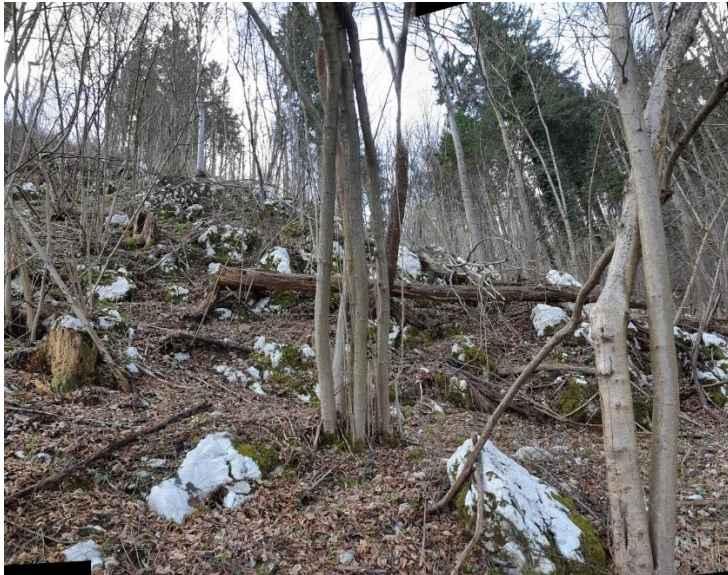
Slika 8 Pogled na pobočje Pustega gradu na območju profila P4 in P5. Izdanki apnenca.