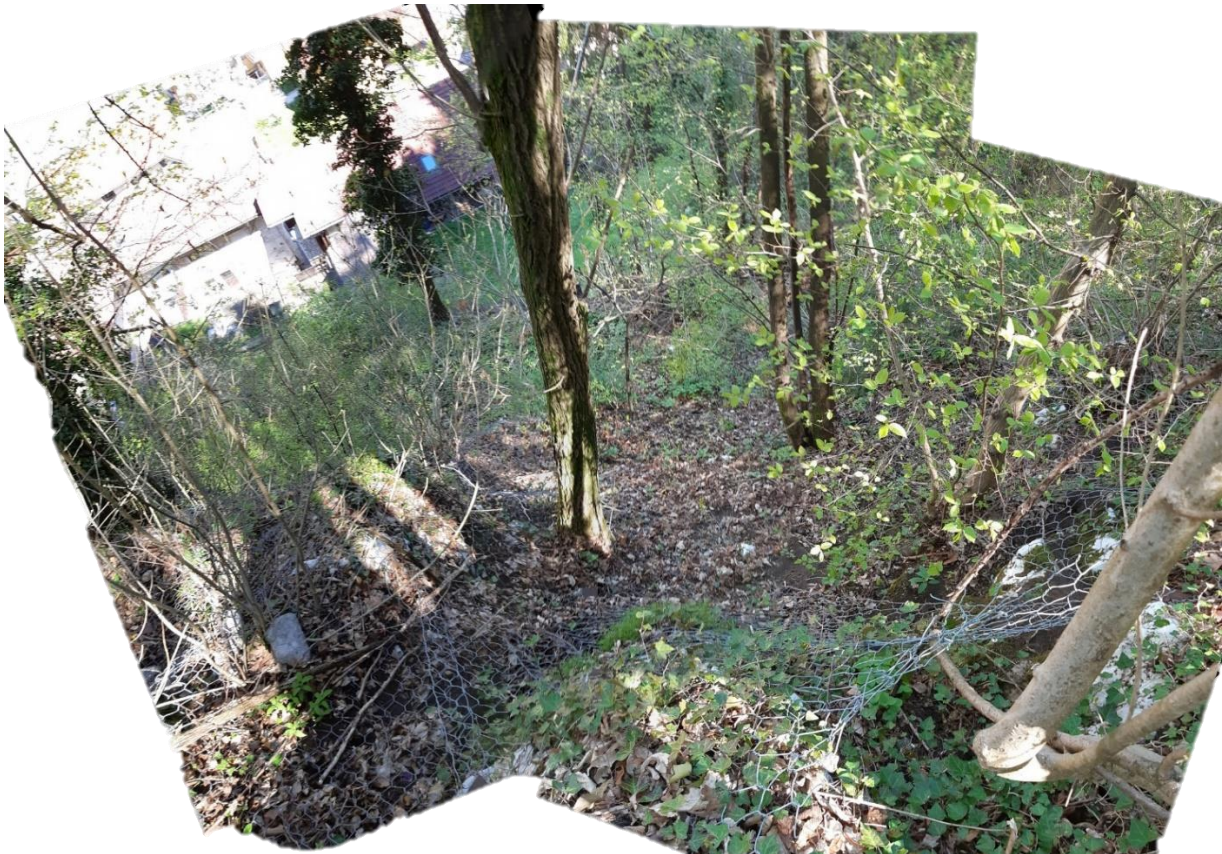
Slika 5 Del strme brežine nad Partizansko potjo 3a, delno prekrito z žično mrezo.