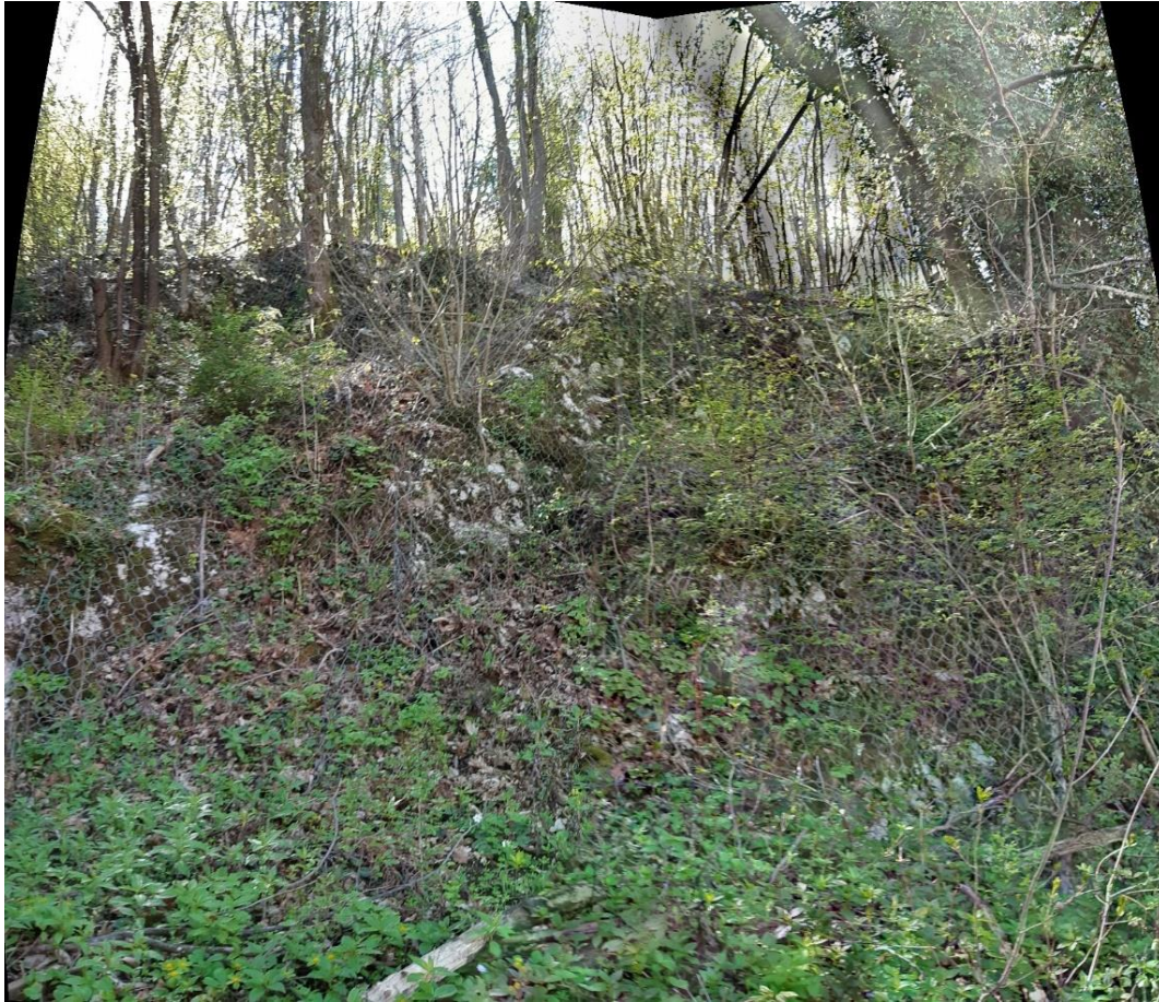
Slika 6 Del strme brežine nad Partizansko potjo 3a, delno prekrito z žično mrezo (pogled od spodaj).