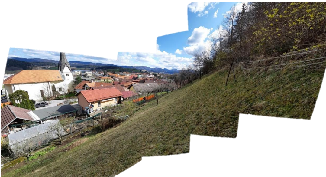
Slika 2 Panorama spodnjega travnatega dela pobočja pod Pustim gradom – nad Partizansko potjo 7.