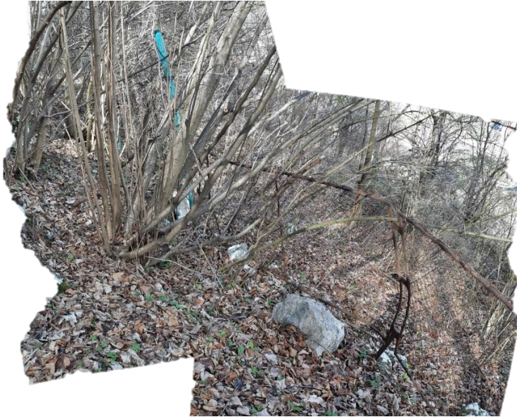
Slika 11 Ograja nad objektom Partizanska pot 9 je zaustavila večji skalni blok, pri tem se je ograja deformirala (med profili P5 in P6).