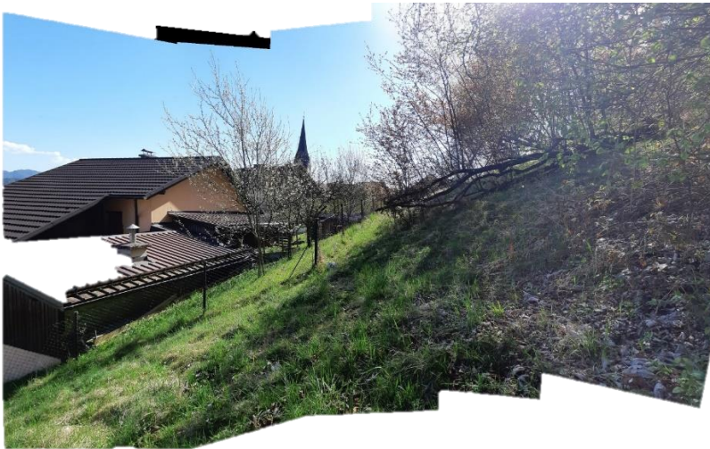
Slika 12 Teren nad objektom Partizanska pot 15. Travnik in gosto grmičevje, posamezni skalni bloki za ograjo objekta.