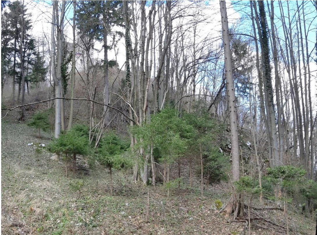
Slika 4 Vzhodni del pobočja Pustega gradu. Strm zgornji del pobočja, veliko izdankov in labilnih blokov (P1)