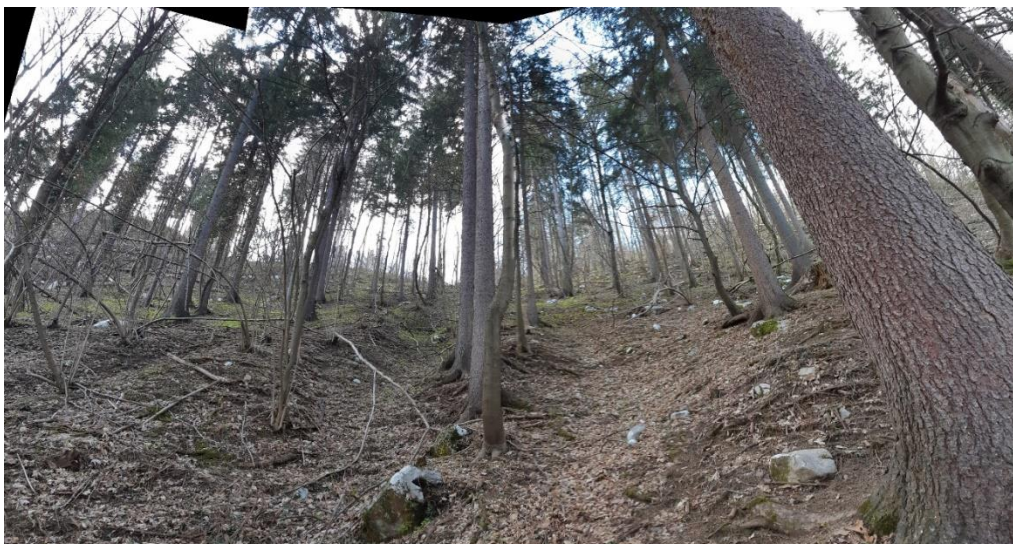
Slika 10 Redek gozd brez podrasti in erozijske drče po pobočju. Malo izdankov in skalnih blokov.